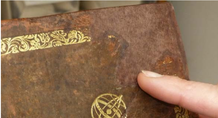
Hoekrestauratie van de Van Keulen atlas met nieuw leer

veerd en gerestaureerd weer in de kasten van de bibliotheek. Wisselend zullen bijzondere exemplaren zoals bv. de 18 e eeuwse Atlas van Johannes van Keulen, door de conservator 'uitgelicht' worden, zodat het werk van het restauratieatelier getoond kan worden en deze boeken voor een breder publiek zichtbaar worden.