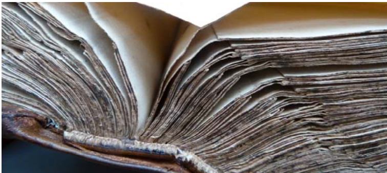
Kaarten in de Van Keulen atlas werden, waar nodig, opnieuw bevestigd. Restauratie werd mogelijk gemaakt door het Fentener van Vlissingenfonds