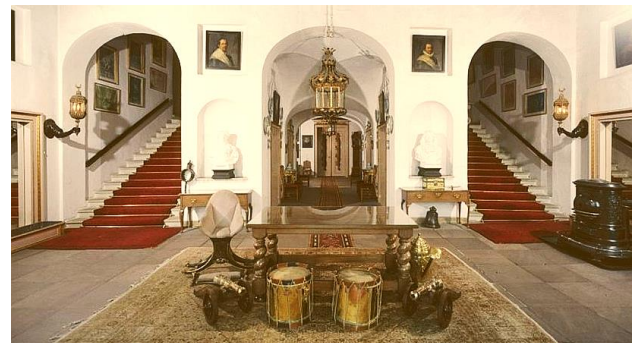
Trappenhuis Kasteel Amerongen

Behalve dat de 'Huizen' aan de buitenkant op elkaar lijken, n.l. een rechthoekig bouwblok (zgn Hollands Classicisme), lijken ze ook van binnen op elkaar door de bouw van trappen in het midden van het huis, een grote zaal achter die trappen en privé-vertrekken links en rechts van het trappenhuis.