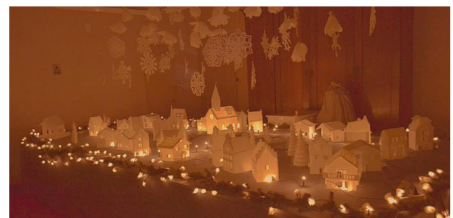
Het fraai verlichte "kerstdorp" van de Engelen in 2015

Drie vrijwilligers hebben op hun beurt een speciale band met deze drie landen vanwege hun familiehistorie en/of interesse. En zo krijgen we dit jaar een Engelse bibliotheek, een Duitse gobelinkamer, een Deense eetzaal en de salon als kinderkamer.