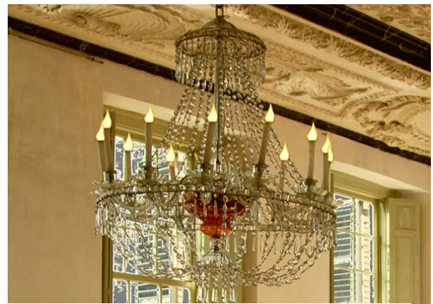
Nieuw licht op de zaken

Indien u het kasteel bezocht in donkere dagen dan kon u zien dat in de kroonluchters verschillende lampjes niet meer functioneerden. Vervanging bleek een probleem i.v.m. verkrijgbaarheid en veiligheid. De Vriendenkring heeft daarop besloten gelden vrij te maken om alle lampen in kroonluchters en op andere plaatsen te vervangen door LED-kaarsen. Nadat onze conservator en penningmeester een bezoek hadden gebracht aan museum Van Loon in Amsterdam en daar een prima demonstratie kregen door de fa. Van Ramselaar werd het besluit genomen deze firma de opdracht te verstrekken. Inmiddels is het project gerealiseerd voor ongeveer € 6900,- en kunnen de kroonluchters op afstand worden gedimd.