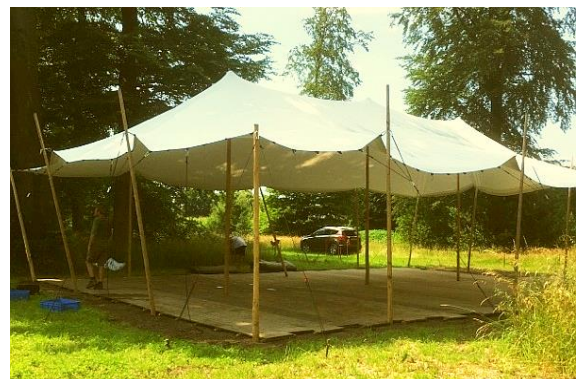
De partytent in opbouw

Om het bijzondere behang in de Bentinckkamer te behouden voor de toekomst zijn maatregelen nodig. Een particuliere gift van ruim € 14.500,- werd ter beschikking gesteld als de Vriendenkring € 2.500,- voor het project beschikbaar wilde stellen. Daarop zijn we natuurlijk graag ingegaan. Het project is gestart.