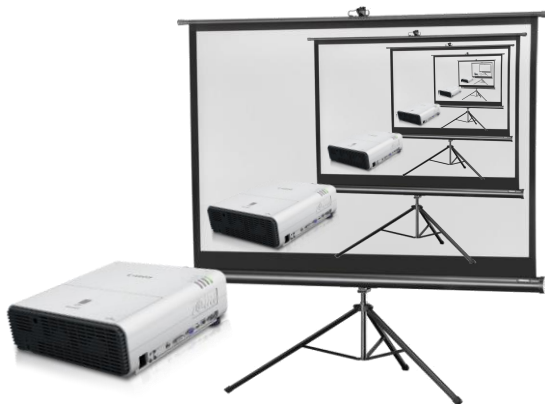
De nieuwe Canon XEED WUX400ST beamer

Voor de expositie van de “Vijf sterke vrouwen” is een speciale beamer aangeschaft, die grote lichtsterkte paarde aan een zeer breed projectievlak en een korte projectieafstand. Wij namen de financiering van de projector voor onze rekening ten bedrage van € 4200,-