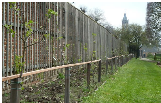
De 70 m lange leibomen galerij met rechts het begin van de berceau

Hopelijk zal de haag er na enkele jaren uitzien zoals de haag op een landgoed in St. Pierre le Vieux Normandie in nevenstaande foto.