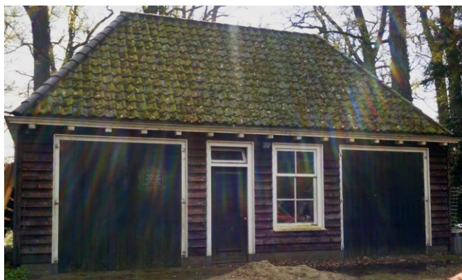
De nu nog somber ogende Schellevisshuur