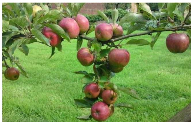
Appelhaag op een landgoed in St. Pierre le Vieux Normandie