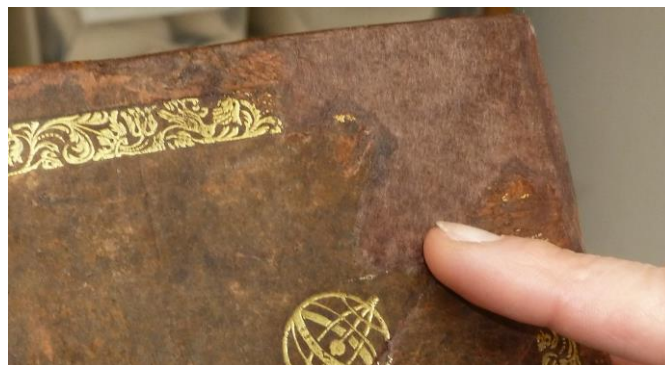
Hoekrestauratie met nieuw en op kleur gebracht leer