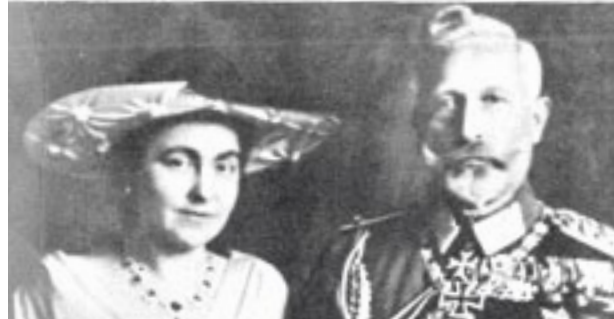
De keizer met zijn tweede vrouw.