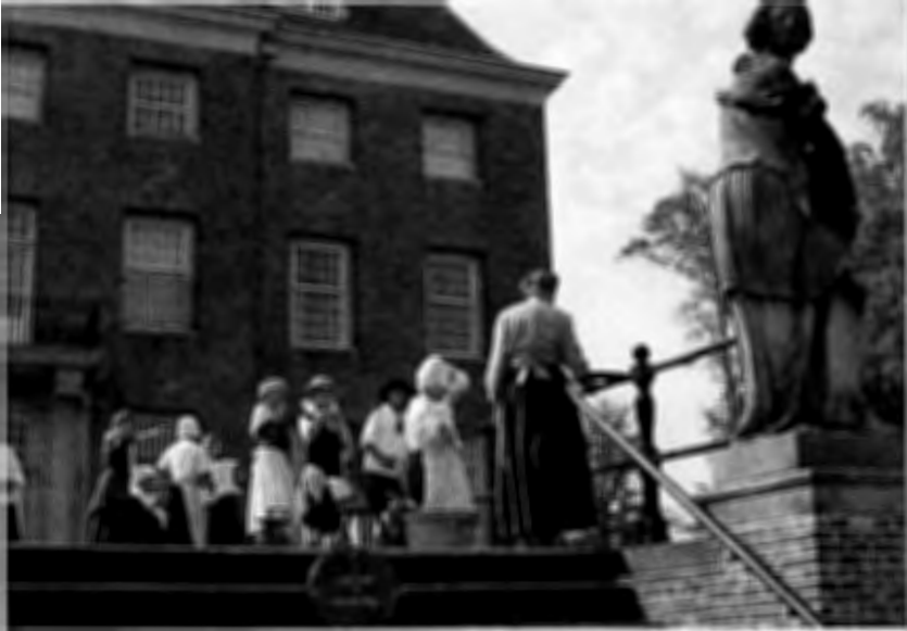
De scène speelt zich nu af op het kasteelbordes.

Alle teksten zijn al improviserend ontstaan en tot een verrassend stuk gemaakt door de regisseur, Birgit van der Jagt. Amerongse thema's, zoals de onderdanigheid van de bevolking aan de bewoners van het kasteel, het rechtspreken