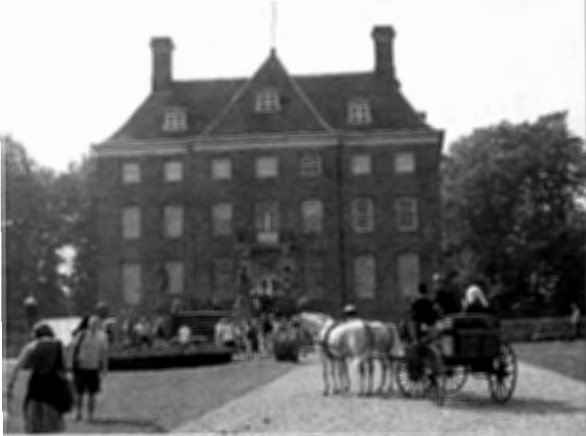
Enthousiaste dorpsgenoten voeren een ‘historisch’ toneelspel op.

Na een genoeglijke slentertocht langs de kraampjes, lonkt de tuin van het kasteel. Daar voltrekt zich een ‘historisch’ schouwspel.