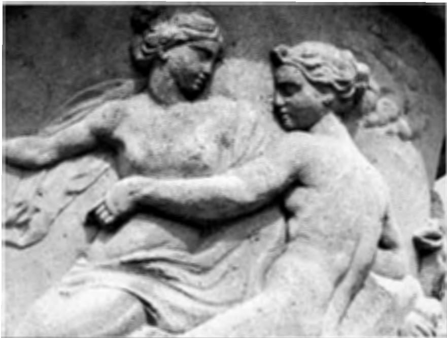
Details van een voorstelling op de tuinvazen in de kasteeltuin.