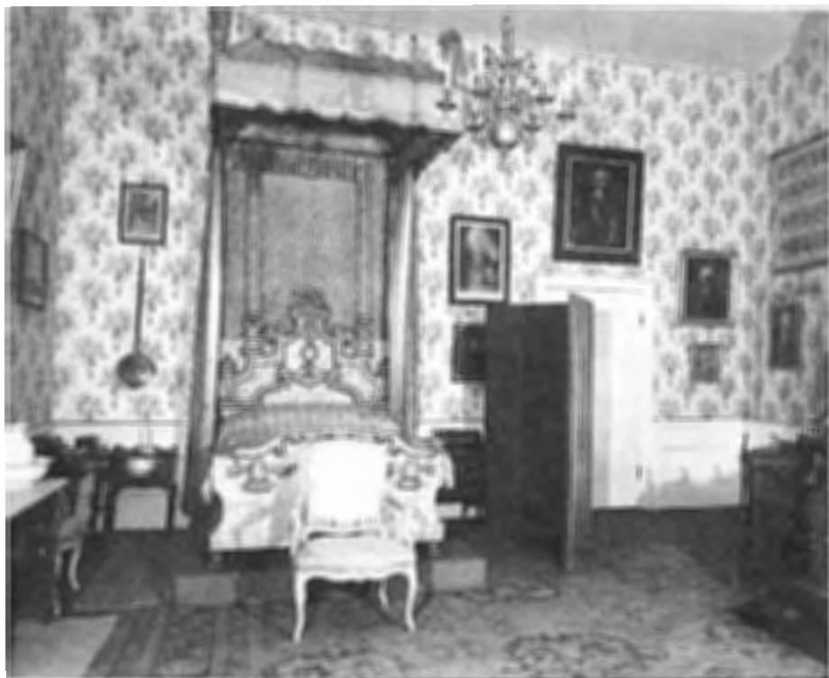
Het bed in de Lodewijkkamer.

Ook over licht, lucht en klimaat en de invloed daarvan op materialen, weten we nu veel.