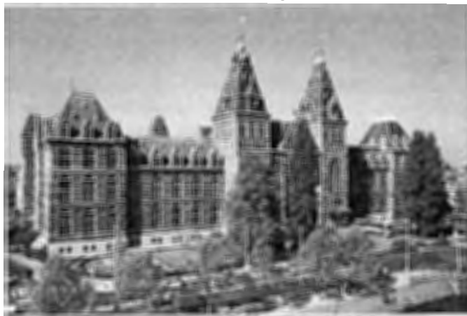
Het Nieuwe Rijksmuseum Amsterdam

Hoofdvestiging: Westsingel 9, 3811 BA Amersfoort (033) 463 17 05 (tel.) (033) 461 08 54 (fax) e-mail: bureau@vanhoogevest.nl website: www.vanhoogevest.nl