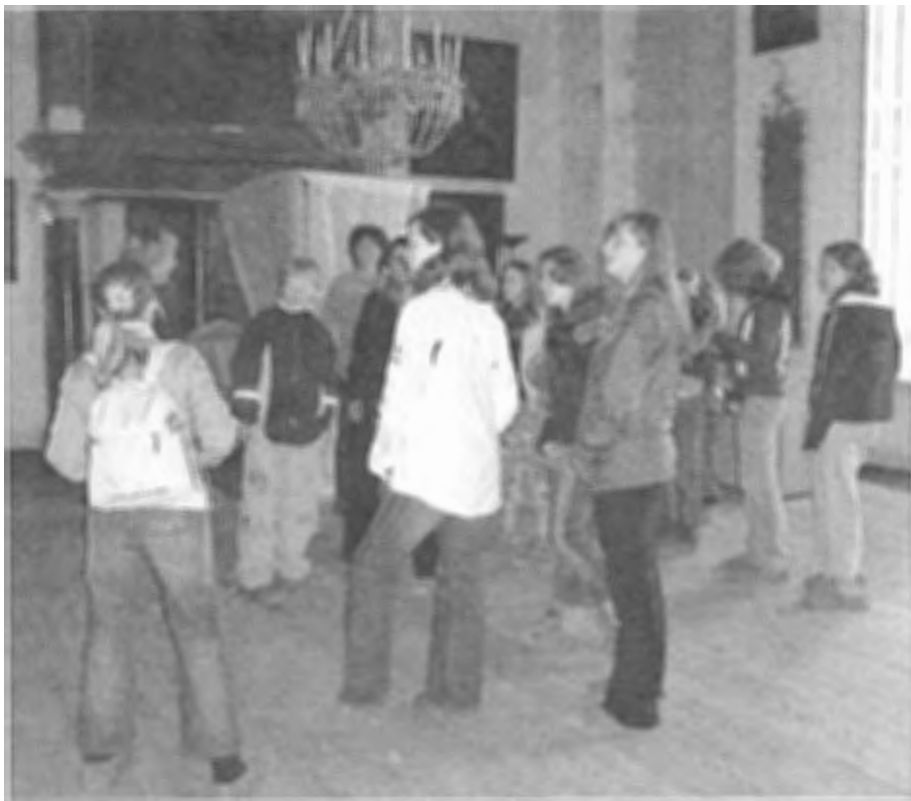
Aan bezoekers, groot of klein, worden sloffen uitgedeeld om over hun schoenen te dragen.

gezichten merken zij dat de kinderen ineens verbanden ontdekken, of dingen gaan beseffen: “oh, dus als een kind vroeger zo oud was als wij moesten ze wel 12 uur per dag werken zonder vrije dagen!?”.