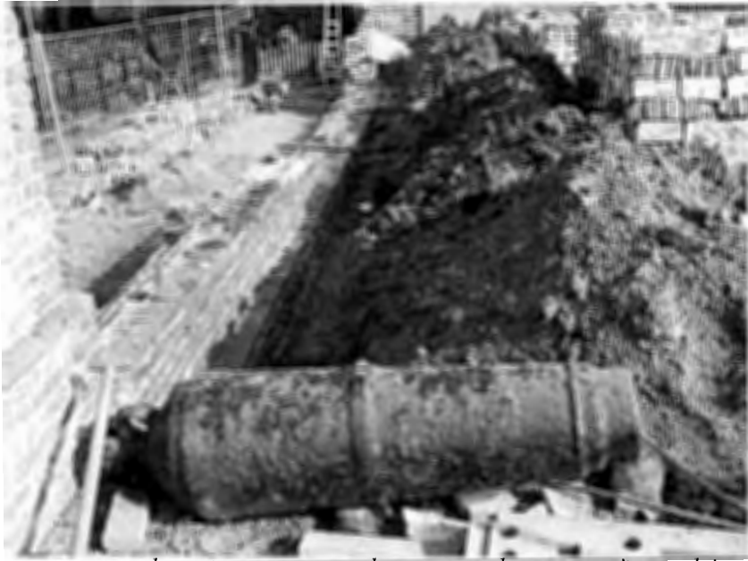
Steen voor steen demonteren en weer opbouwen van de muren op 't voorplein.