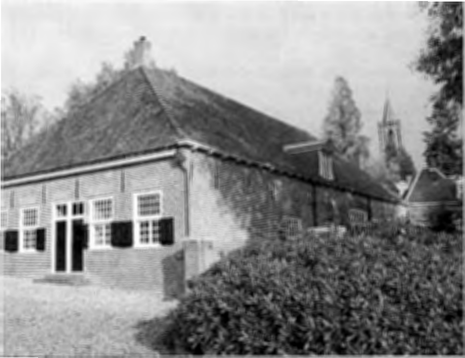
't Poortgebouw na restauratie, in afwachting van .....

Intussen nadert het Poortgebouw ook zijn voltooiing. Het bestuur zoekt gegadigden die dit gebouw en eventueel andere bijgebouwen willen gaan exploiteren. De bedoeling is dat het Poortgebouw een Grand Café wordt.