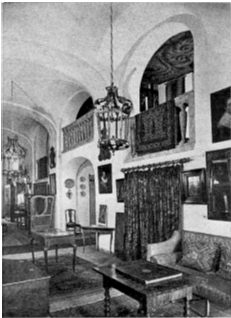
Een overvloed aan textiel in de Lange gang.