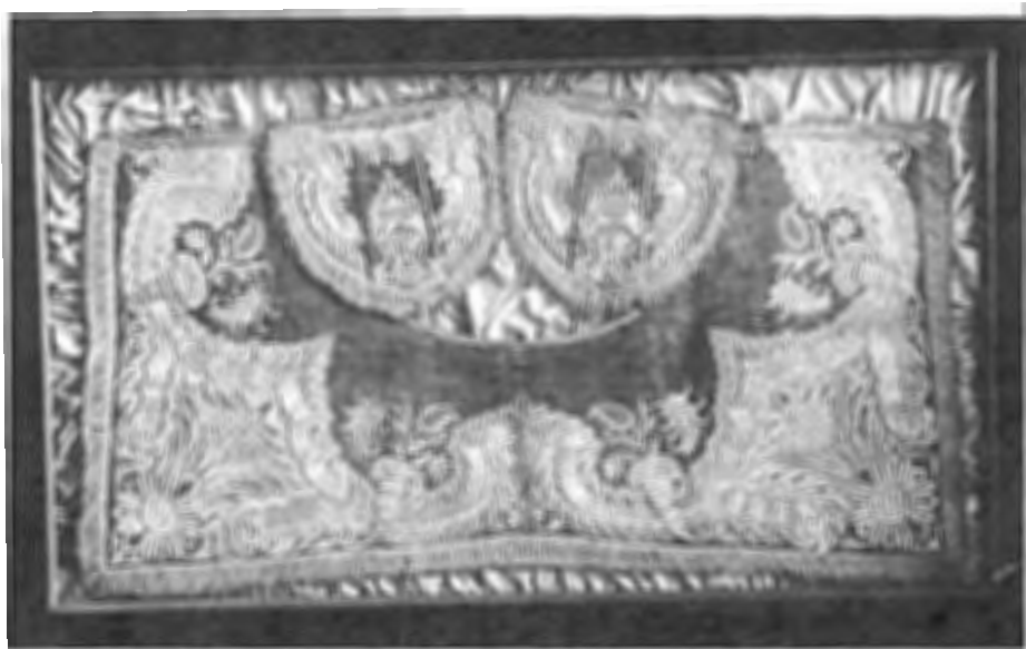
Zeventiende eeuwse Brandenburger schabrak van fluweel met zilverborduursel.

Nico komt tot de conclusie dat conservering nog tot in het oneindige zal blijven doorlopen.