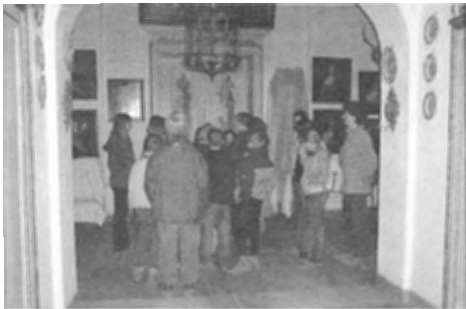
Leerlingen van groep 7/8 op avontuur in Kasteel Amerongen.

Door kinderen te laten kennismaken met historische verhalen en door hen mee te nemen naar hun eigen culturele erfgoed, wordt de interesse daarvoor gewekt. Een kijkje binnen de muren van het kasteel, zal hun voorstellingsvermogen verder prikkelen.