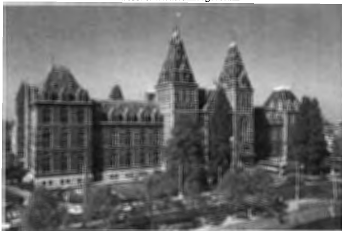
Het Nieuwe Rijksmuseum Amsterdam

Hoofdvestiging: Westsingel 9, 3811 BA Amersfoort (033) 463 17 05 (tel.) (033) 461 08 54 (fax) e-mail: bureau@vanhoogevest.nl website: www.vanhoogevest.nl