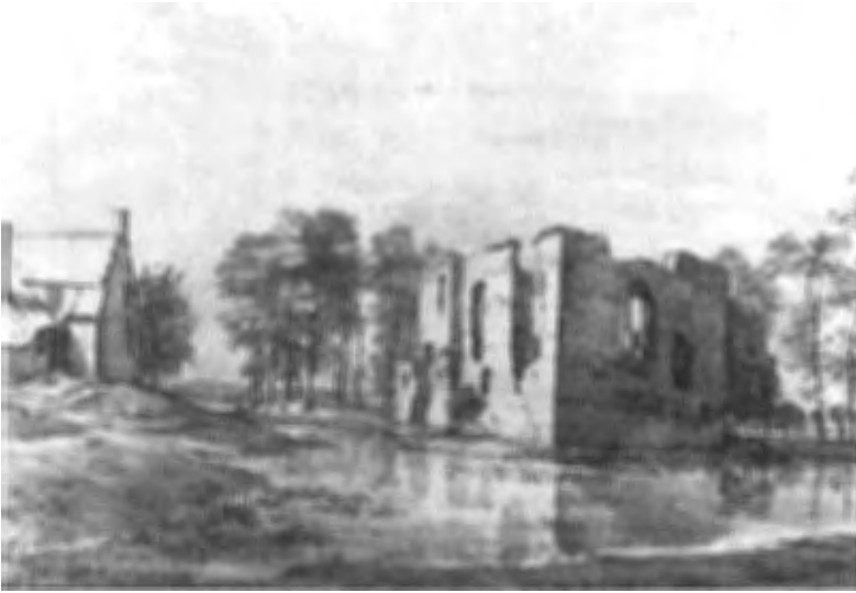
De kasteelruïne van Lievendaal door Roghman vanuit het noordwesten getekend. De boerderij op de voorburcht dateert uit het begin van de 17 de eeuw. De gracht werd omgeven door de nog bestaande singel. TMH, O**19.

Lievendaal had waarschijnlijk niet meer dan twee verdiepingen. Op een kaart uit 1597 is het huis getekend, geheel omringd door bomen (8).