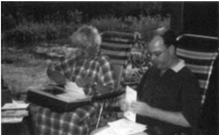
Vrijwilligerswerk kan inspannend, maar ook ontspannend zijn.

Tijdens de eerste bijeenkomst inventariseren wij de inhoud, gaan op zoek naar kopij, of maken die zelf (wie schrijft waarover?). Afbeeldingen die de tekst ondersteunen hebben onze voorkeur; wij trachten deze zoveel mogelijk zelf bij elkaar te zoeken.