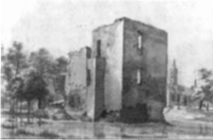
De ruïne van kasteel Lievendaal, in 1646/47 door Roelant Roghman vanuit het zuidoosten getekend. Het rechter bouwdeel is mogelijk een woontoren. Links is de nog bestaande singel te zien en rechts de voorburcht met het bijgebouw. Daarachter is de toren van de Andrieskerk in Amerongen herkenbaar.