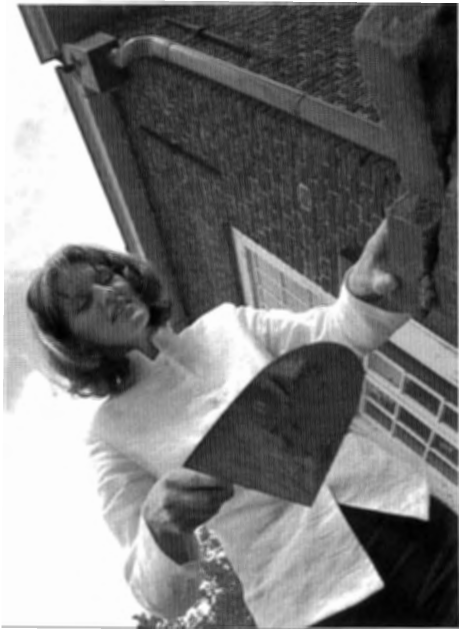
Staatssecretaris van Cultuur en Media Medy van der Laan gaf het startsein voor de restauratie fase II op 27 juni 2003.