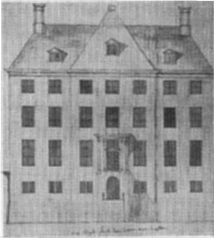
Schets van de voorgevel (ca. 1673)