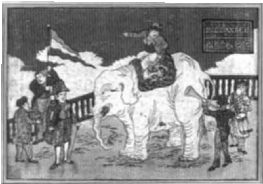
Prent 'Hollander' Roëll Kunst & Antiquiteiten

vinden. Antiekbeurs Kasteel Amerongen heeft in de afgelopen jaren een naam opgebouwd van een goede kwaliteit antiek en een prima prijs-kwaliteit verhouding. Het aanbod, de entourage en gezellige sfeer maken de beurs beslist een bezoek waard.