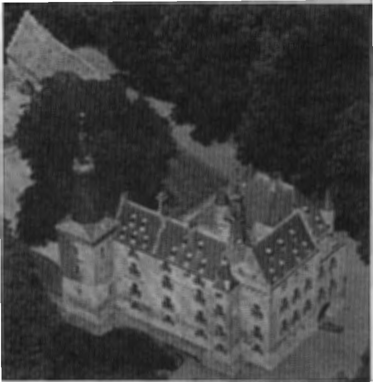
Kasteel Doorwerth, Gld. Hoofgebouw en voorburcht in welstand (1928).