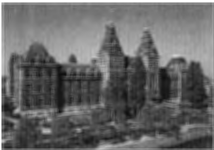
Het Nieuwe Rijksmuseum Amsterdam

Kantoor: Utrecht Achter de Dom 10, (030) 2319195 (tel.), Amsterdam Jan Luijkenstraat 10, (020) 5720851 (tel.)