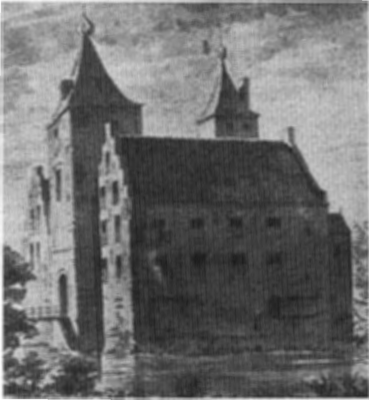
Kasteel Amerongen voor 1673 A.S. (A. Schouman).

'Ick weet dat U, Furst Dt. Een oud geëxperimenteert liefhebber van Architecture is, en derhalve, dat hem niet sal vervelen, dat ik hem de Pop (waarmede ick nu drie jaeren gespeelt heb, ende die de Vrouw van Amerongen ende mij de Beurs seer plat maakt) eenighsints met haar couleuren afbeelde.' 14)