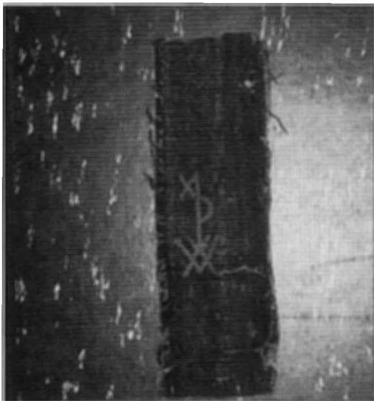
stukje tapijtrand met monogram, uit de werkplaats van de familie de Pannenmaecker, Brusselse tapijtwevers tussen 1500 en 1700.

oud-conservator D. Pezarro (die er bij was)