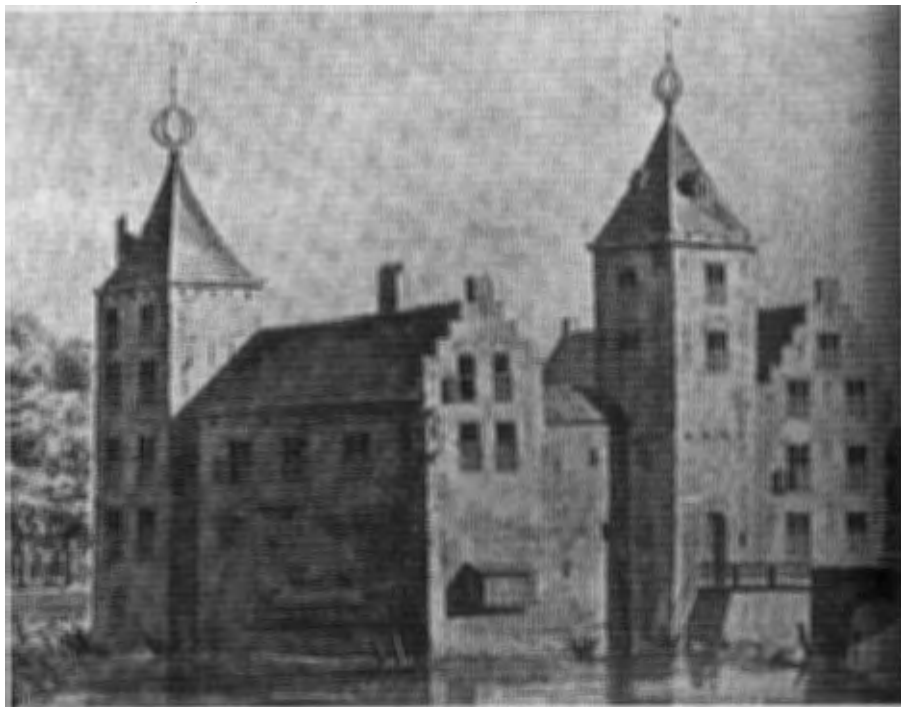
Het slot Amerongen, vóór de verwoesting van 1673. Tekening hoogstwaarschijnlijk van A.S. A.S. staat voor A. Schouman.

In: Het Kasteel Amerongen en zijn bewoners door A.W.J. Mulder. Maastricht 1949.