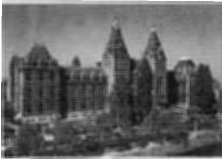
Het Nieuwe Rijksmuseum Amsterdam

Kantoor: Utrecht Achter de Dom 10, (030) 2319195 (tel.), Amsterdam Jan Luijkenstraat 10, (020) 5720851 (tel.)