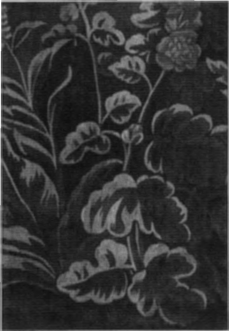
detail van het wandtapijt "verdure met kraanvogels" uit de Lange Gang van Kasteel Amerongen.