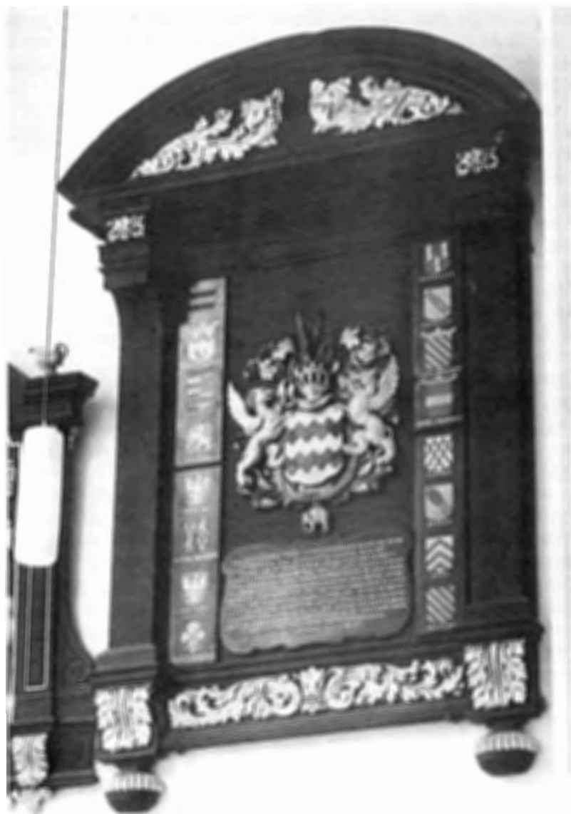
Wapenbord in de N.H. kerk te Amerongen gewijd aan Godard Adriaan Baron van Reede foto: Rijksdienst voor de Monumentenzorg Collectie: Kerkvoogdij Andrieskerk, Amerongen.