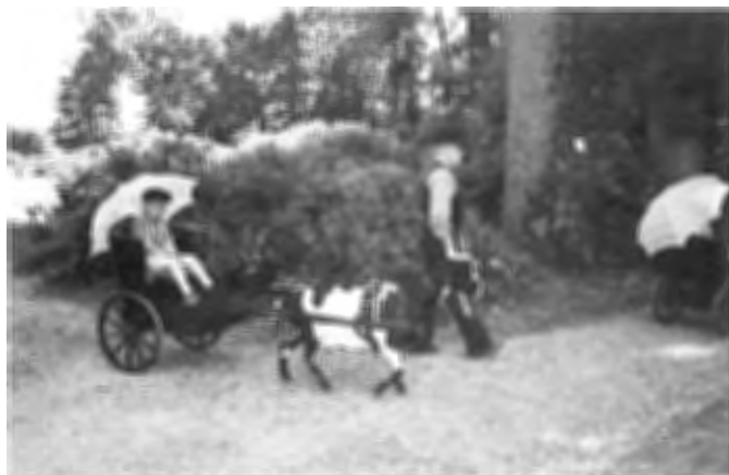
's Zomers plezier.