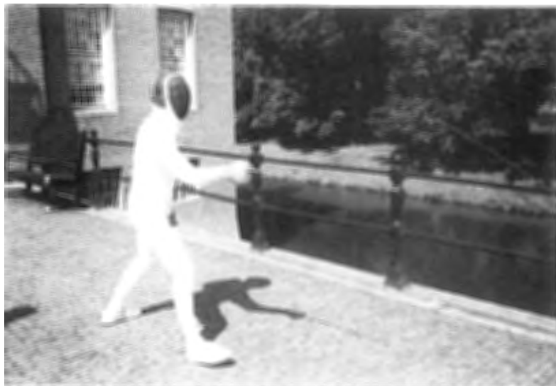
De tegenstander wordt uitgedaagd.....