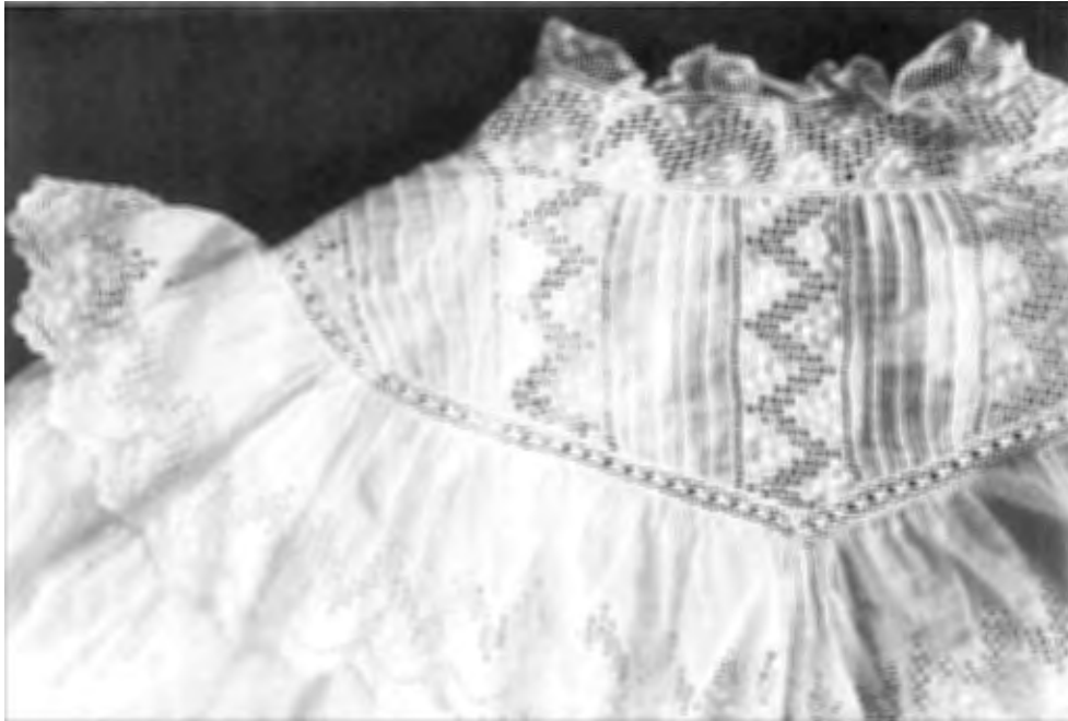
Detail van een meisjesjurk uit ± 1910, Collectie Stichting Kasteel Amerongen.