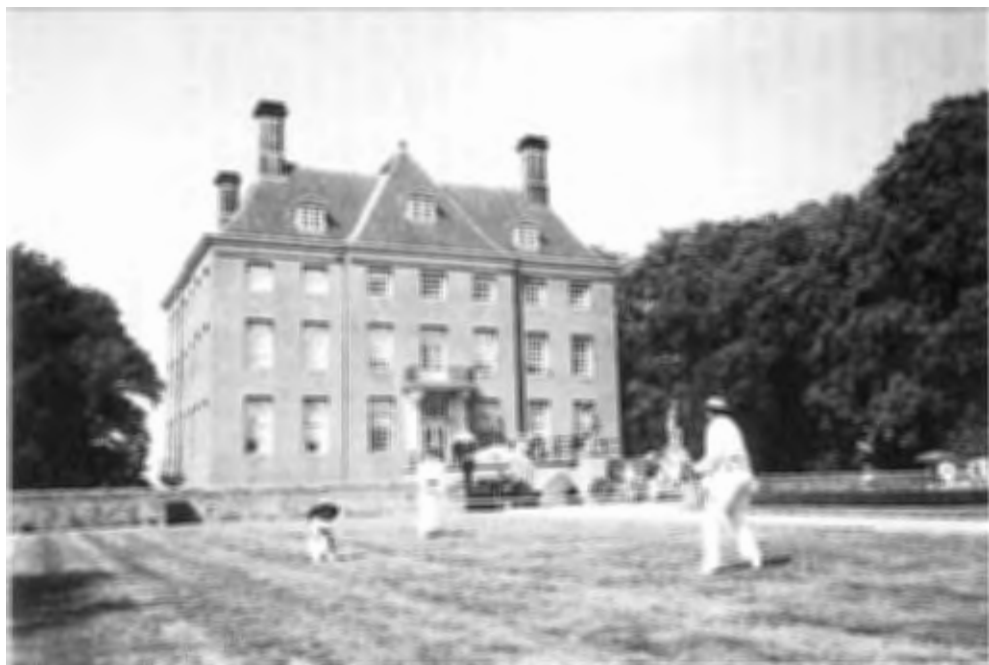
Sfeervolle 'Buitendag' op Kasteel Amerongen 1 augustus 1999 foto: P. Knuijt