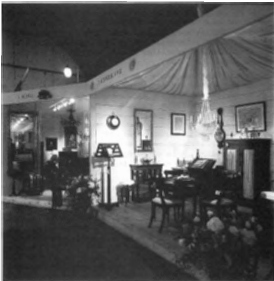
detailopname van de Antiekbeurs in het Koetshuis van Kasteel Amerongen

Dit jaar is de benedenverdieping van het Zuiderpaviljoen beschikbaar voor de antiekbeurs en in de tuin zullen hedendaagse bronzen beelden van onder andere Caius Spronken worden tentoongesteld.