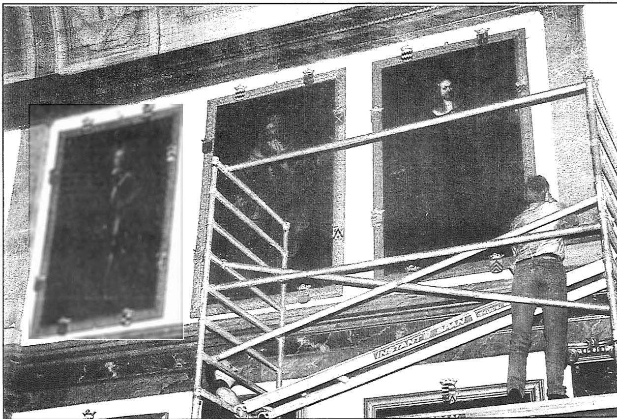
Het meer dan twee meter hoge schilderij wordt door medewerkers van Paleis Het Loo voorzichtig losgehaakt van de 10 meter hoge Galerijmuur in Kasteel Amerongen.