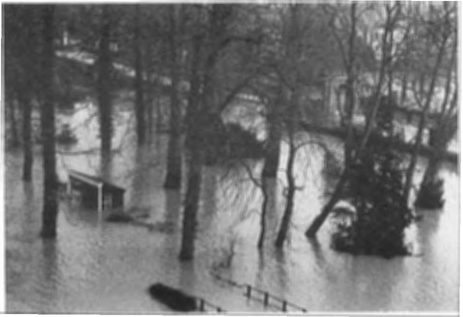
Amerongen, 3 feb. 1995