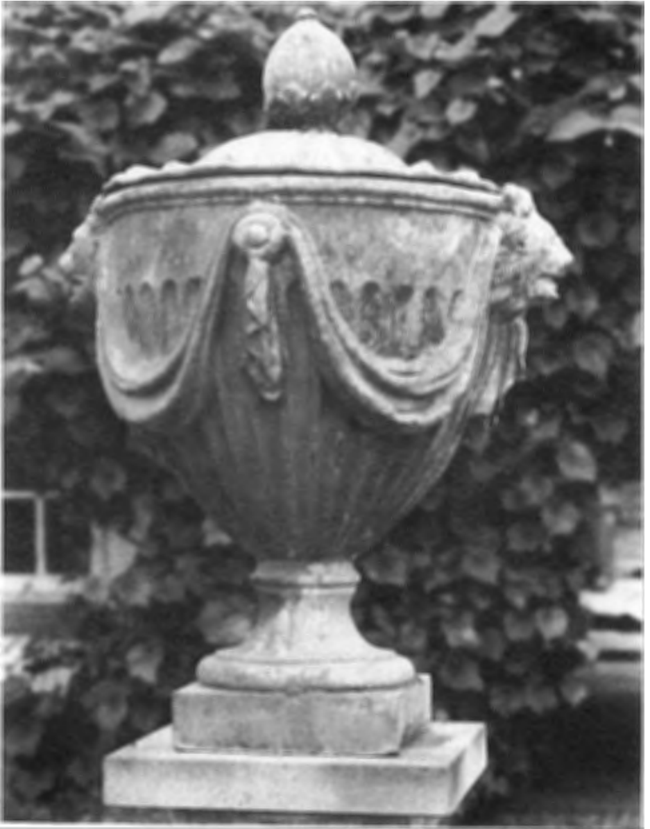
Antiekbeurs Kasteel Amerongen Engelse loden tuinvaas naar Amsterdams model begin 20ste eeuw.