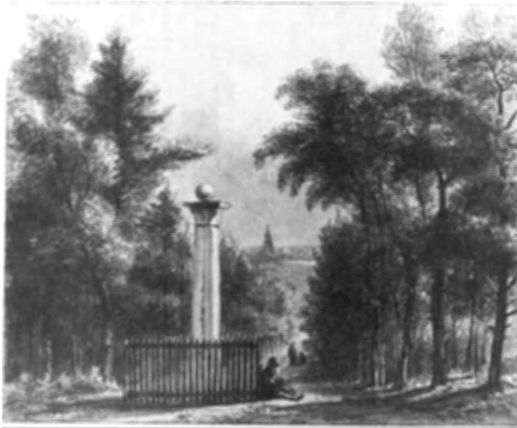
Gedenkzuil Waterloo bij Amerongen foto Teylers Museum, Haarlem.