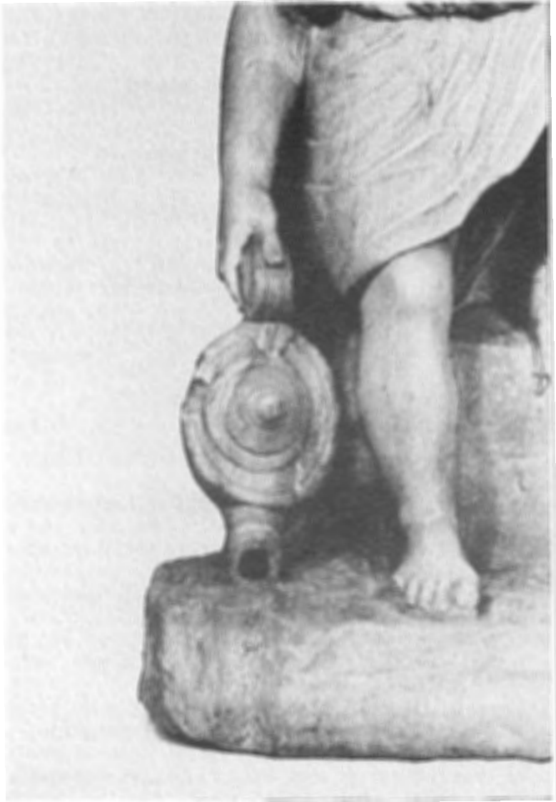
Amerongen, fig. 4. Kasteel Amerongen, Romeins beeldje. Detail: lamp