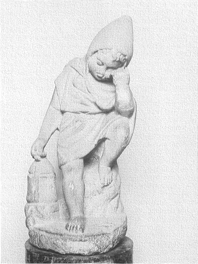
fig. 6. Rome, Museo Nazionale delle Terme 125587. Romeins beeldje (Telesphoros).