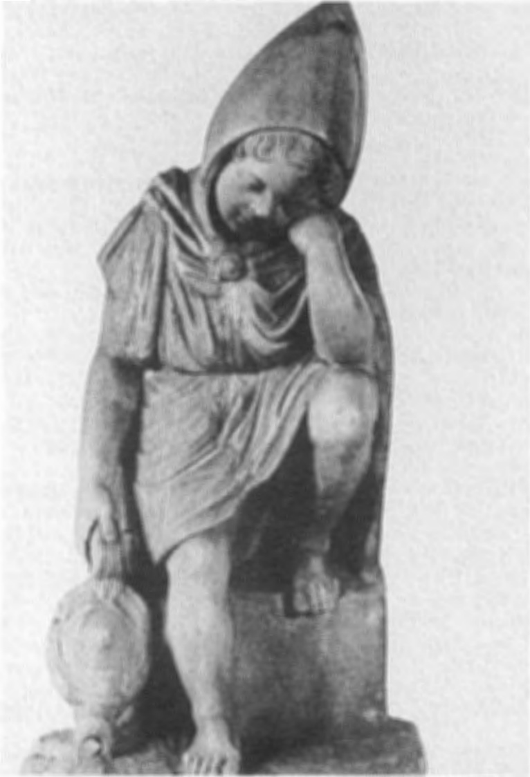
fig. 2. Kasteel Amerongen, Amerongen. Romeins beeldje. Voorzijde.