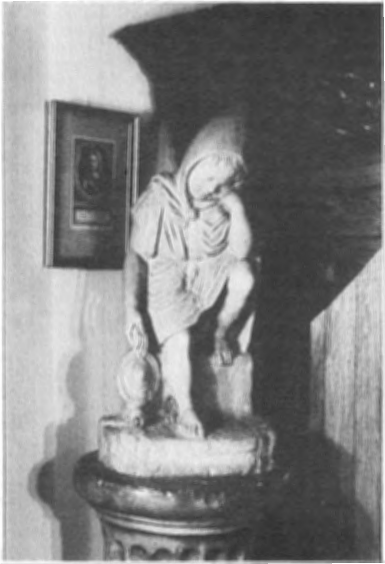
Amerongen, fig. 1. Kasteel Amerongen, vestibule.