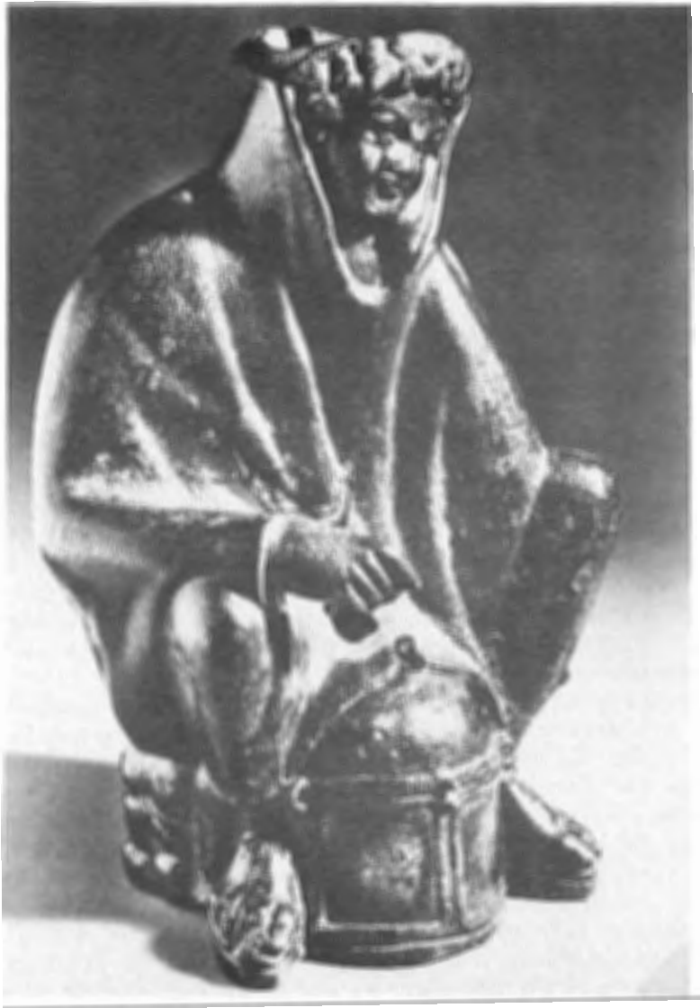
fig. 8. Mainz, Römisch-Germanisches Zentralmuseum. Bronzen lamp uit Herculaneum (slaaf).