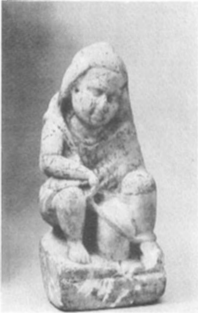
fig. 7. New York, Metropolitan Museum of Art 23.160.82. Romeins beeldje (slaafje).